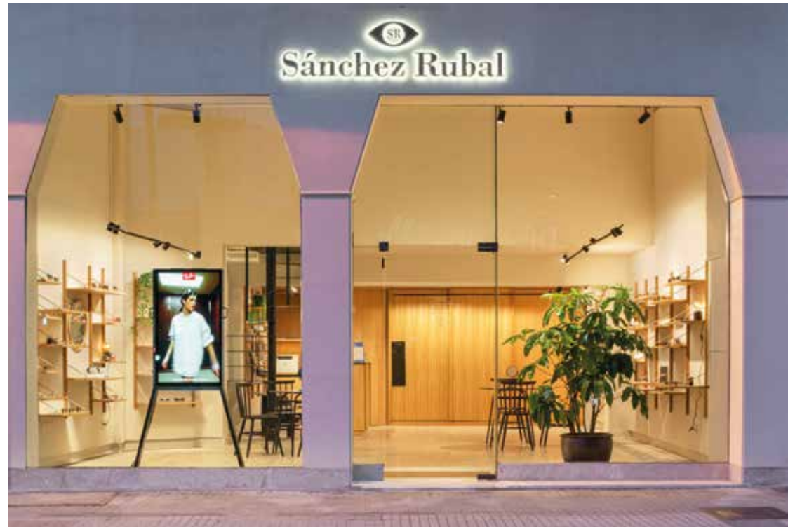
REFORMA EN ÓPTICA SÁNCHEZ RUBAL Ubicación: A Coruña. Plazo de ejecución: 2 meses.