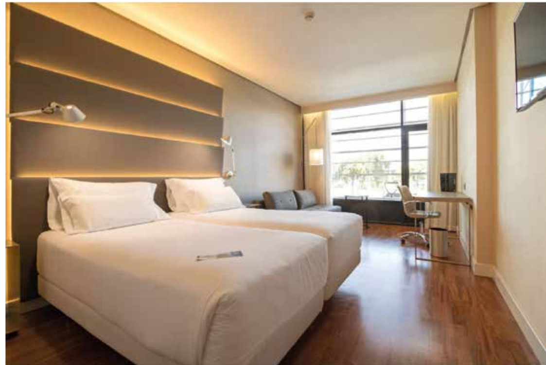
REFORMA EN HOTEL NH PLAZA DE ARMAS Ubicación: Sevilla. Plazo de ejecución: 11 meses.