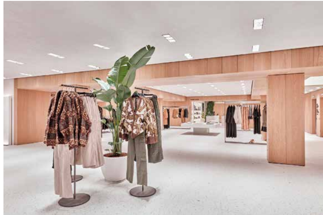
LOCAL COMERCIAL Ubicación: Valencia