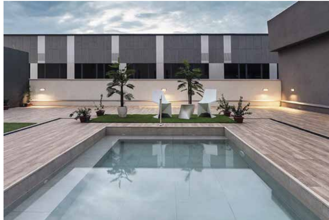
HOTEL BESTPRICE ALCALÁ Ubicación: Madrid. Plazo de ejecución: 12 meses.