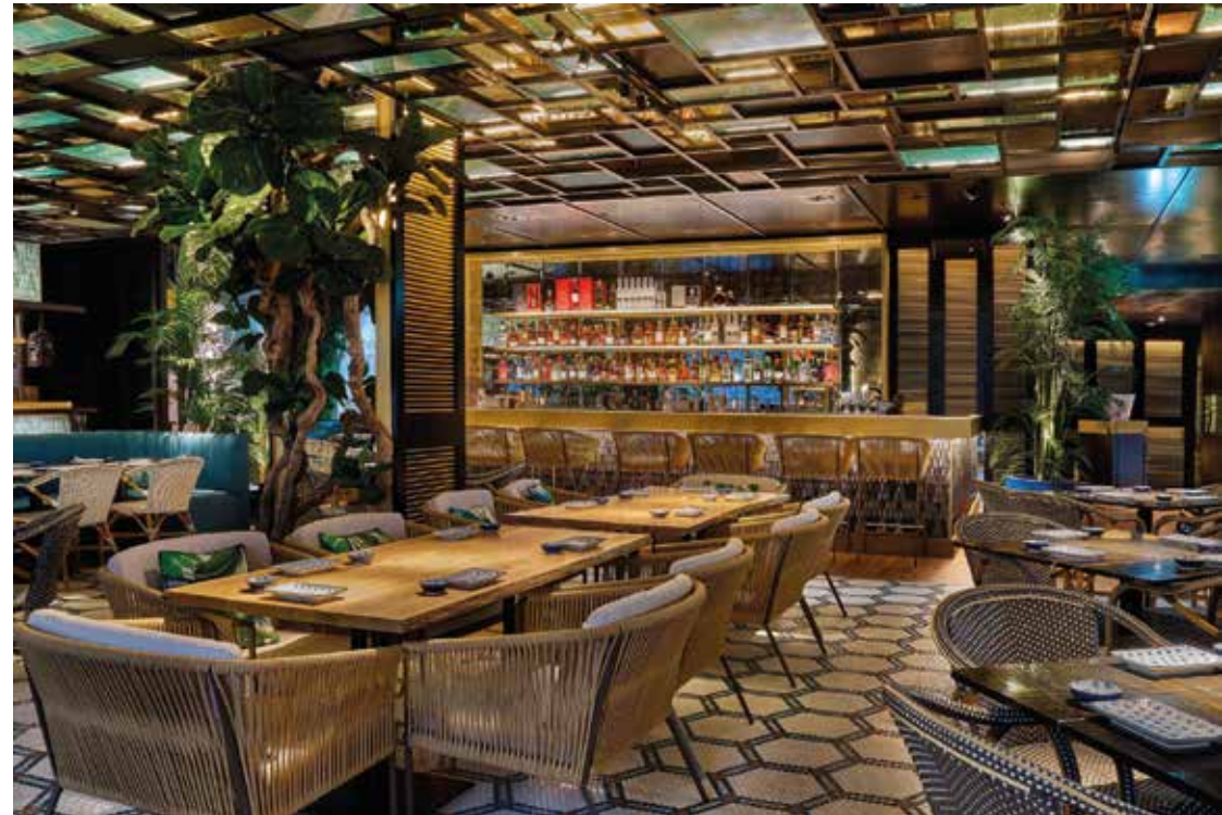
RESTAURANTE ZELA Ubicación: Londres. Plazo de ejecución: 2 meses.