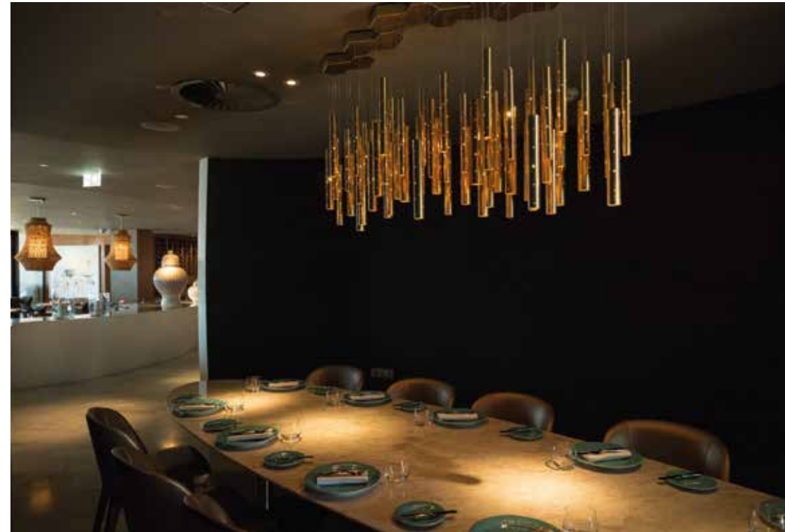
HOTEL FOUR SEASONS CASABLANCA Ubicación: Casablanca (Marruecos). Plazo de ejecución: 5 meses.