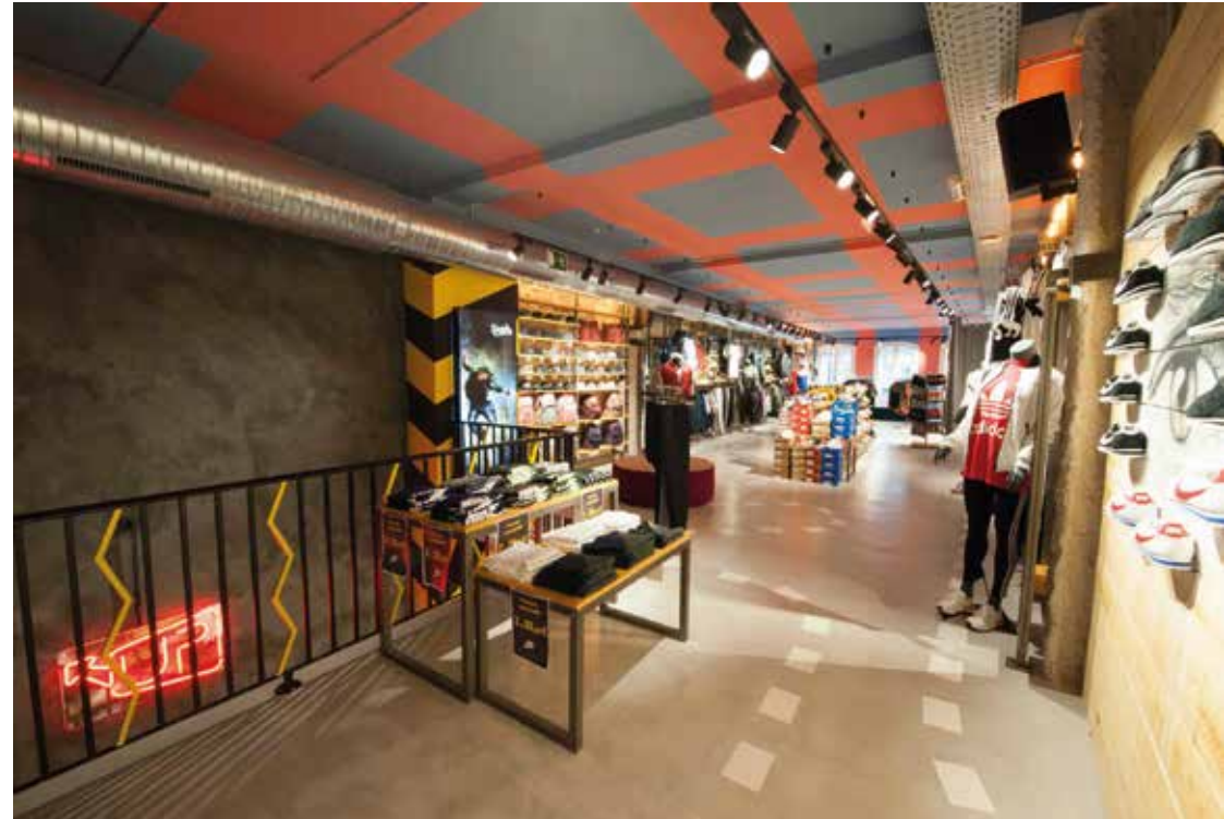
DOERS SNEAKERS Ubicación: A Coruña. Plazo de ejecución: 2 meses.