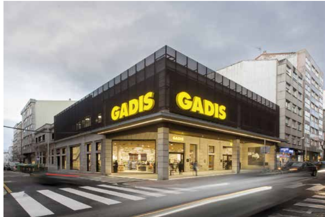
SUPERMERCADO GADIS Ubicación: Pontecedra. Plazo de ejecución: 8 meses.