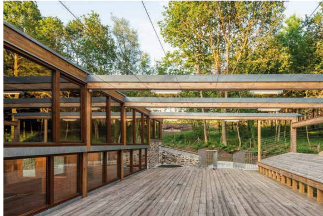
REHABILITACIÓN DE ALOJAMIENTOS RURALES ABEIRO DA LOBA Ubicación: Sobrado dos Monxes (A Coruña). Plazo de ejecución: 12 meses.