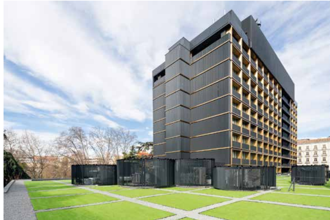
INTERVENCIÓN EN CUBIERTA HOTEL VILLA MAGNA Ubicación: Madrid