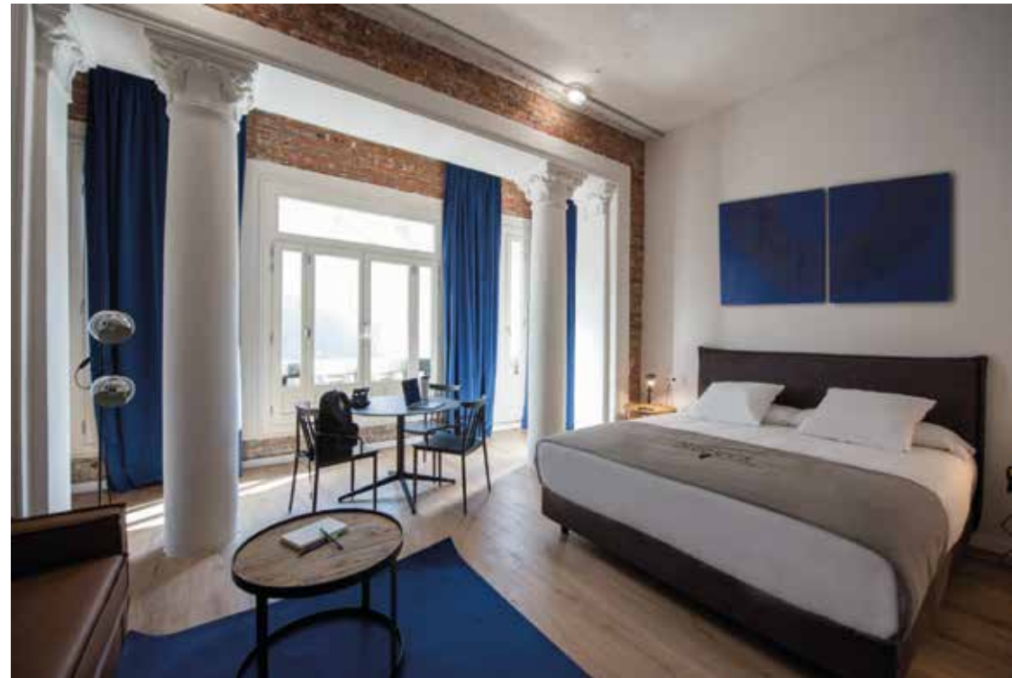
REFORMA EN BLUESOCK HOSTELS GRAN VÍA Ubicación: Madrid.