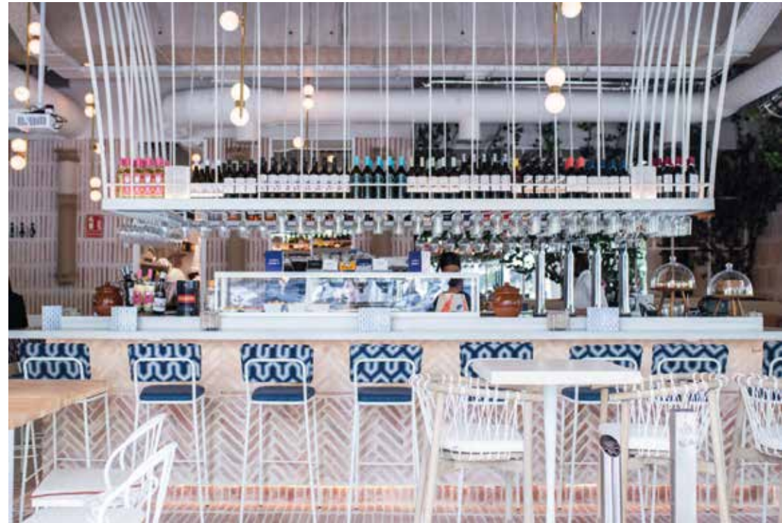
RESTAURANTE LA BIENTIRADA DE MIRASIERRA Ubicación: Madrid. Plazo de ejecución: 5 meses.