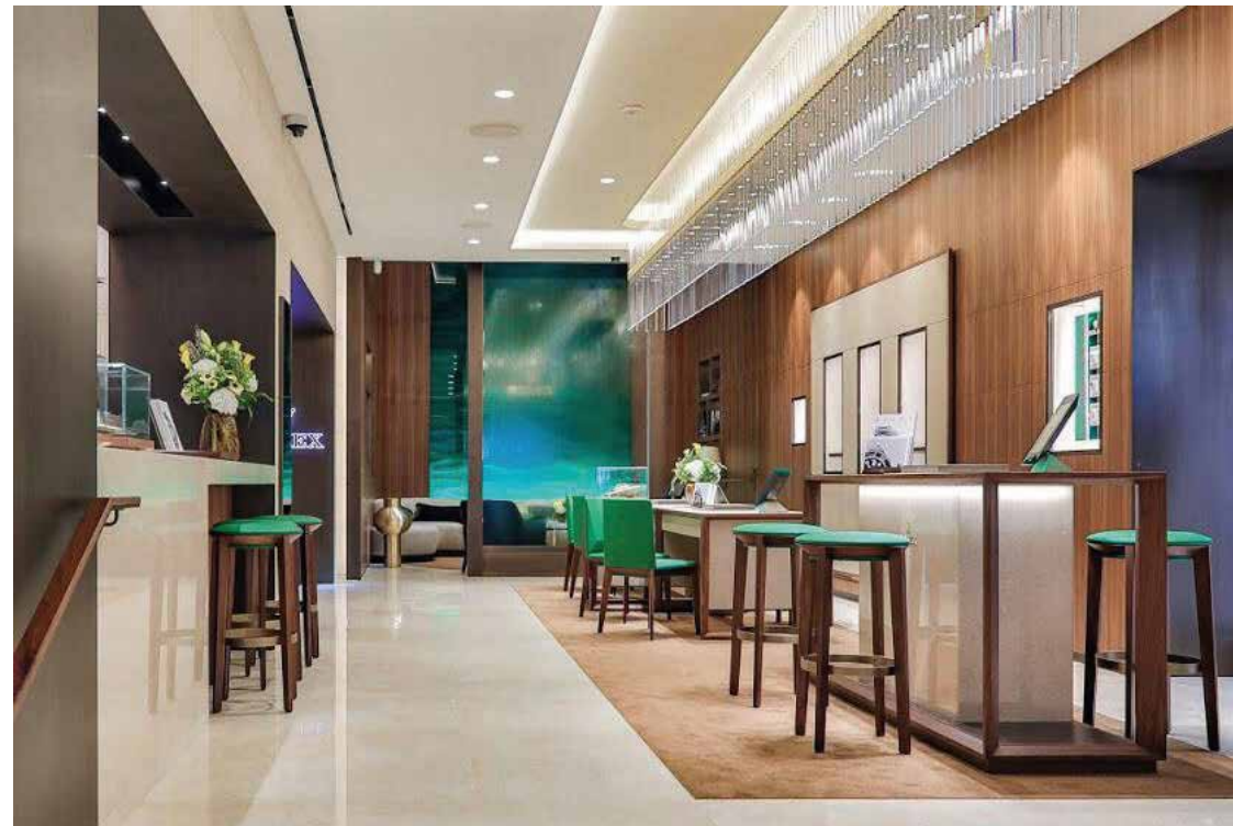
JOYERÍA RABAT BOUTIQUE Ubicación: Madrid. Plazo de ejecución: 6 meses.