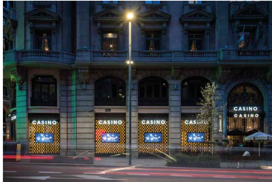
CASINO GRAN VÍA Ubicación: Madrid Plazo de ejecución: 5 meses.