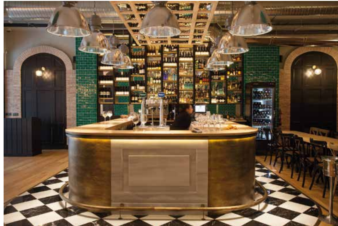
RESTAURANTE LA PENELA Ubicación: Madrid. Plazo de ejecución: 9 meses.