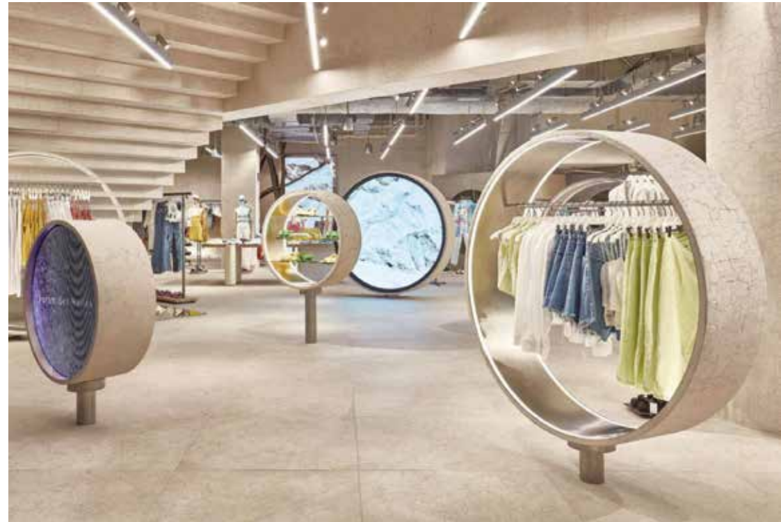
LOCAL COMERCIAL Ubicación: París.