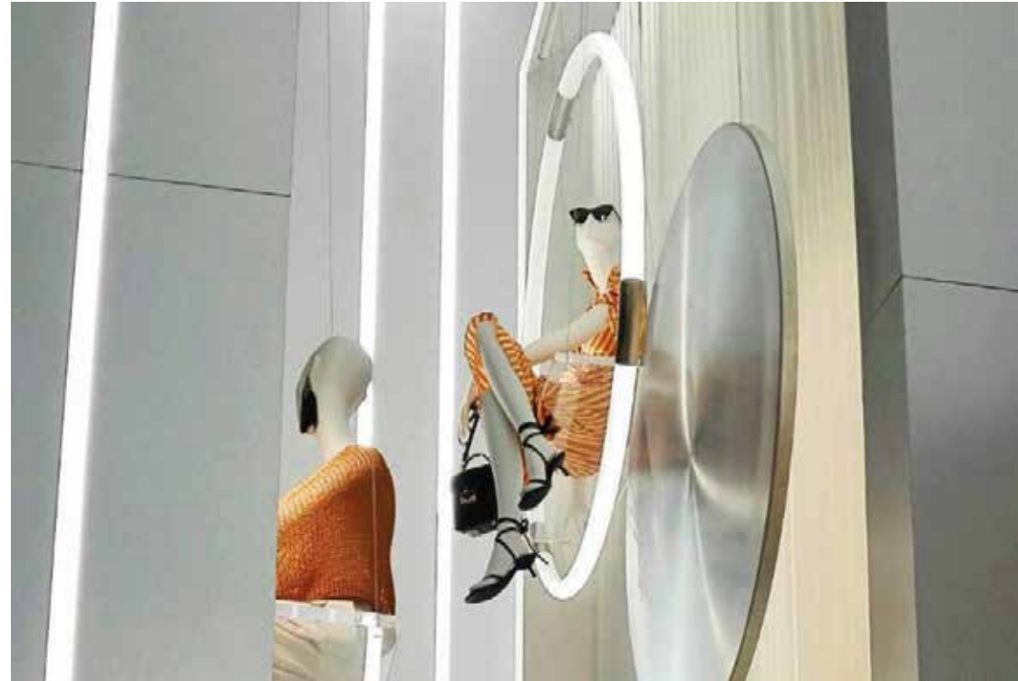
MANGO WHITE CITY LONDRES Ubicación: Londres.